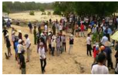
Xung đột ở Quảng Trị