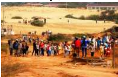
Xung đột ở Ninh Thuận