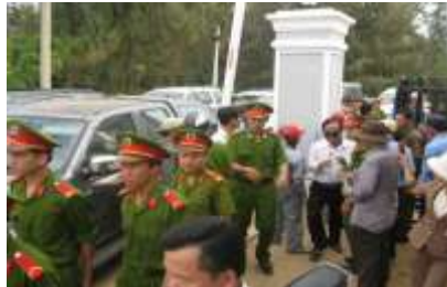
Xung đột ở Bình Thuận