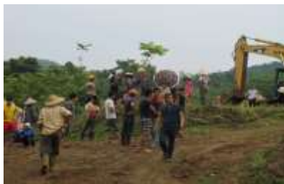
Xung đột ở Hòa Bình