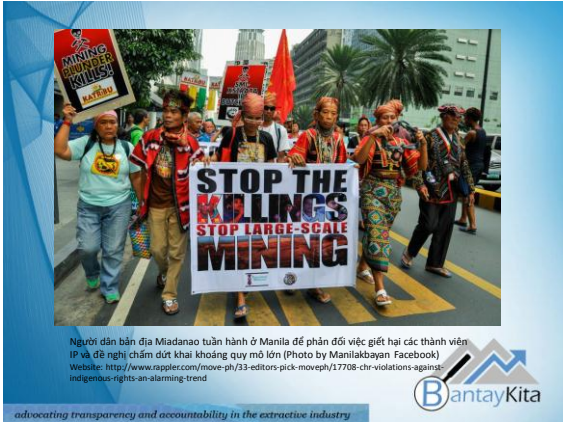
Người dân bản địa Miadanao tuần hành ở Manila để phản đối việc giết hại các thành viên IP và đề nghị chấm dứt khai khoáng quy mô lớn (Photo by Manilabayen Facebook) Website: http://www.rappler.com/move-ph/33-editors-pick-moveph/17708-chr-violations-against-indigenous-rights-an-alarmed-trend