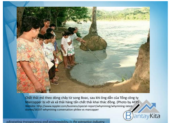
Chất thải mỏ theo dòng chảy từ sông Boac, sau khi ông dẫn của Tổng công ty Marcopper bị vỡ và xả thải hàng tấn chất thải khai thác đồng. (Photo by AFP) Website: http://www.rappler.com/business/special-report/whymining/whymining-latest-stories/16197-whymining-conversation-philex-vs-marcopper

advocating transparency and accountability in the extractive industry