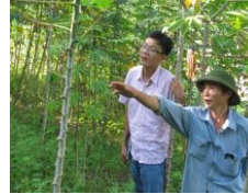
NCTH tại xã Đông Văn và Tiên Phong, huyện Quế Phong (Nghệ An):

150 hộ dân người Thái tái định cư của thủy điện Hòa Na chuyển về đây đã gần 3 năm. Kế hoạch cấp đất sản xuất chưa triển khai. Một phần lớn quỹ đất sản xuất được dành cho dự án trồng cao su (1800 ha). Người dân không có lựa chọn nào khác ngoài việc buộc phải xâm lấn vào rừng để có đất canh tác. Cây sắn được lựa chọn phù hợp nhất trong điều kiện kinh tế hộ hiện tại.