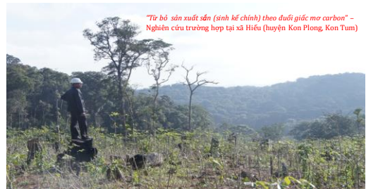
"Từ bỏ sản xuất sắn (sinh kế chính) theo đuổi giấc mơ carbon" – Nghiên cứu trường hợp tại xã Hiếu (huyện Kon Plong, Kon Tum)

Tình thế "tiến thoái lưỡng nan": Bảo vệ rừng, bảo tồn ĐDSH vs sinh kế cây sắn