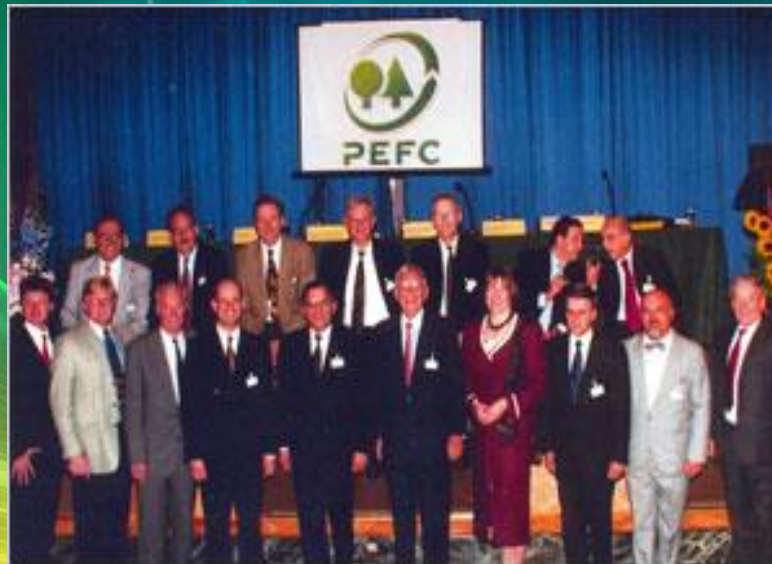
Inaugural PEFC General Assembly (Paris, 1999)