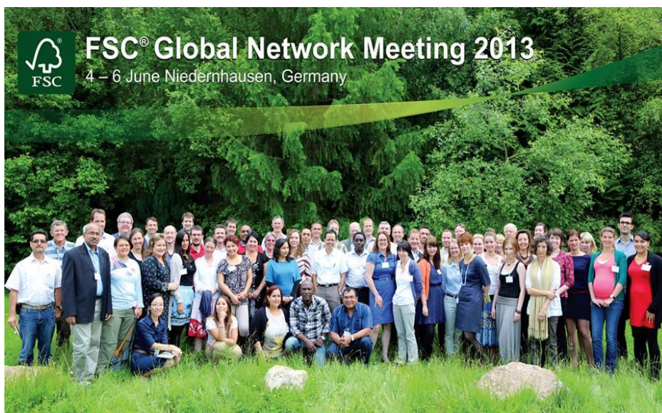
Họp mạng lưới FSC toàn cầu 4-6/6/2013