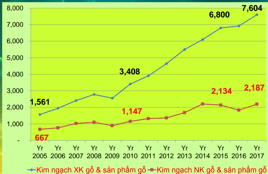
KIM NGẠCH XUẤT NHẬP KHẨU GỖ & SẢN PHẨM GỖ 2005-2017 (Tr. USD)