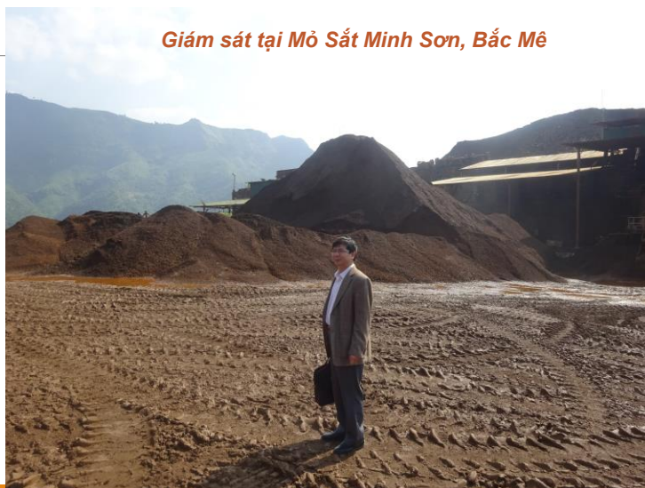
Giám sát tại Mỏ Sắt Minh Sơn, Bắc Mê