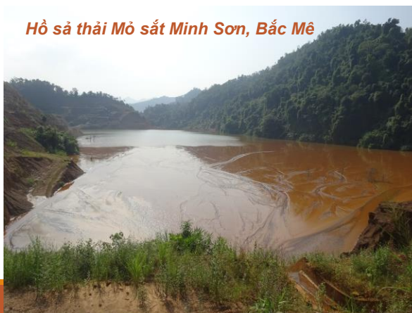
Hồ sả thải Mỏ sắt Minh Sơn, Bắc Mê

Trong khi đó, khai thác khoáng sản luôn tiềm ẩn gây ra những rủi ro lớn tới môi trường: Làm đất canh tác thoái hóa, bị vùi lấp, làm thay đổi dòng chảy và là tác nhân tiềm ẩn có nguy cơ gây ra những trận sạt lở, lũ bùn đất, lũ quét kinh hoàng.