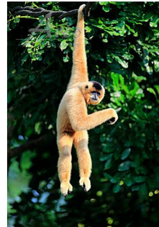
Vượn đen má hung phía bắc