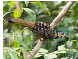
Khướu Kon Ka Kinh