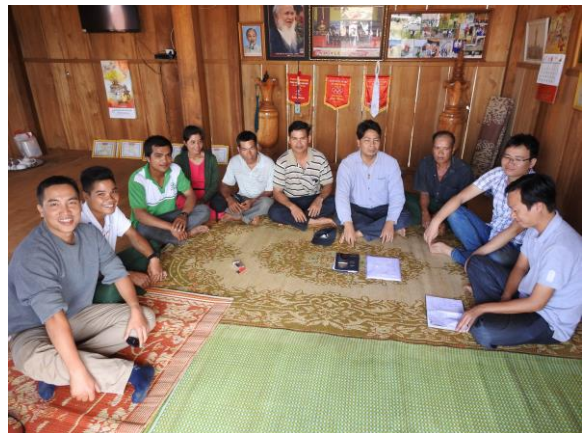
Tổ LNCĐ thôn Kon Lanh Te họp với cán bộ dự án và chủ rừng