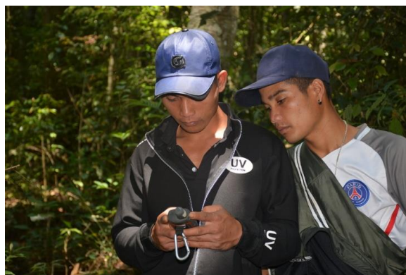
Tham gia các lớp tập huấn kỹ thuật tuần tra bảo vệ rừng và Tuần tra bảo vệ rừng