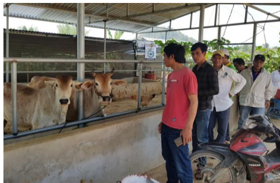
Tham quan các mô hình kinh tế hộ gia đình theo kiểu VAC kết hợp phát triển rừng trong địa bàn huyện Kbang