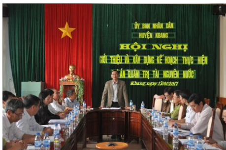
Tham gia hội thảo liên quan dự án và lâm nghiệp