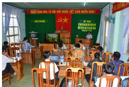
Tham gia các buổi tuyên truyền bảo vệ rừng