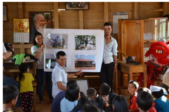
Thực hiện các buổi tuyên truyền về vai trò và ý nghĩa của rừng đối với cộng đồng với sự hỗ trợ của các bộ dự án và chủ rừng