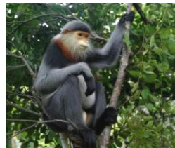
Chà vá chân xám