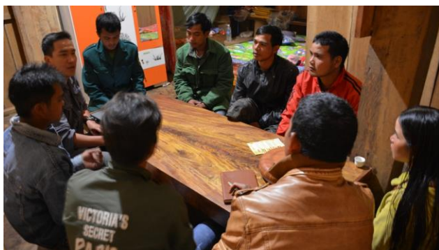
Tổ chức các buổi sinh hoạt thường kỳ (1 tháng/1 lần)