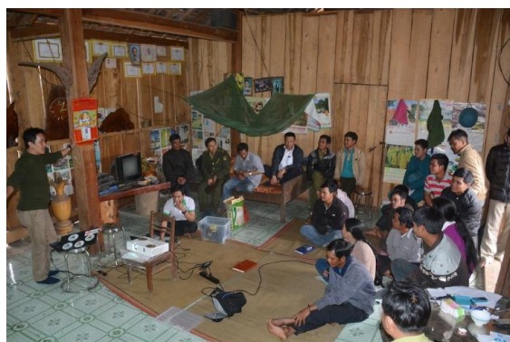
Phối hợp với chủ rừng xây dựng kế hoạch tuần tra bảo vệ rừng hằng năm/ quý/ tháng