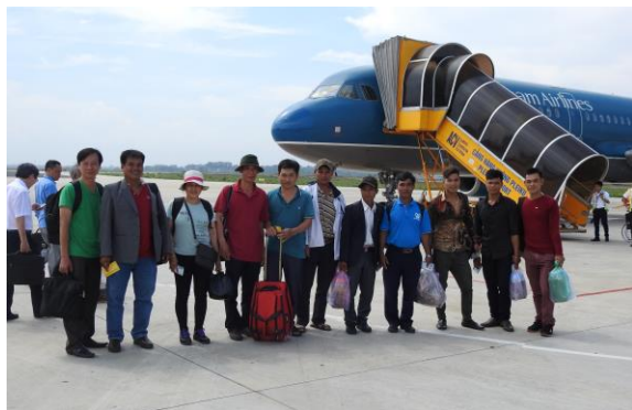
Tham quan học tập các mô hình sinh kế cộng đồng ở các tỉnh Sơn La, Hòa Bình