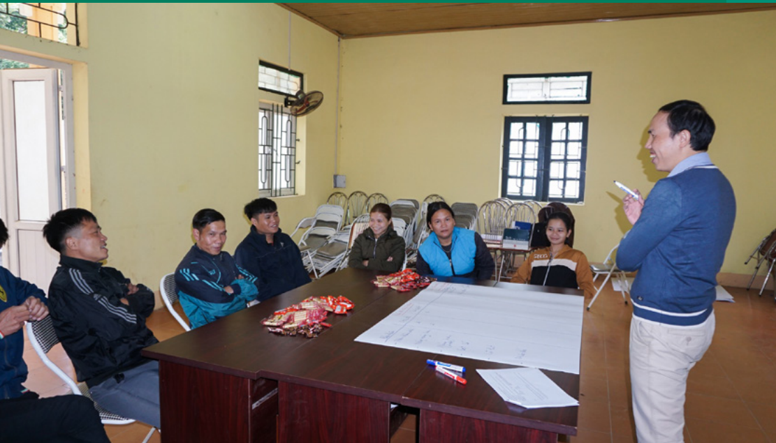
Khảo sát thực địa về mối tương quan giữa biến đổi khí hậu, di cư và sinh kế của các cộng đồng tại xã Nam Tiến, huyện Quan Hóa, tỉnh Thanh Hóa