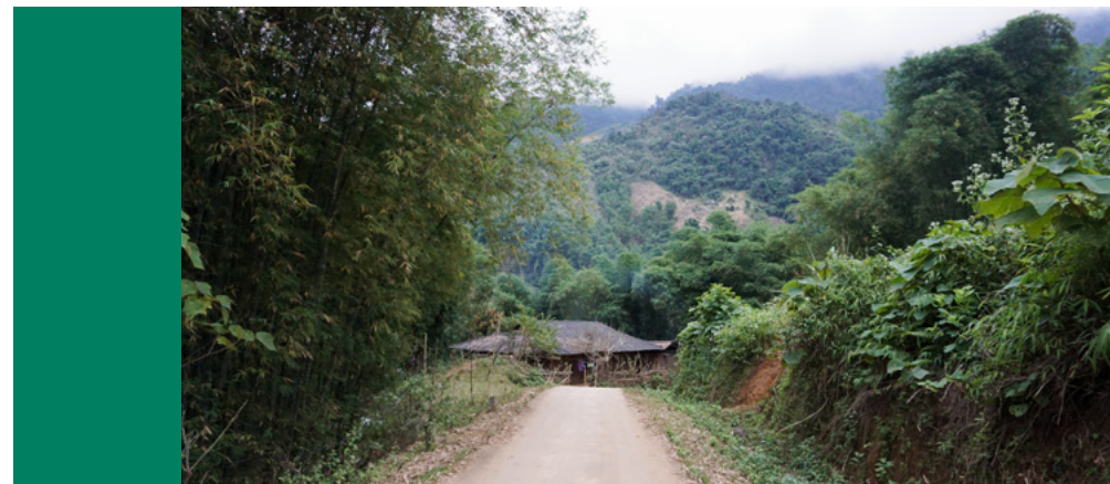
Xã Nam Tiến, huyện Quan Hóa, tỉnh Thanh Hóa