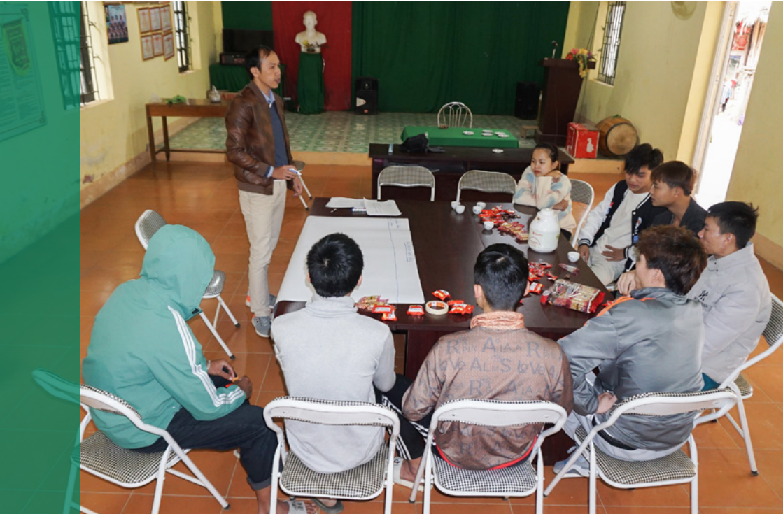
Khảo sát thực địa về mối tương quan giữa biến đổi khí hậu, di cư và sinh kế của các cộng đồng tại xã Nam Tiến, huyện Quan Hóa, tỉnh Thanh Hóa