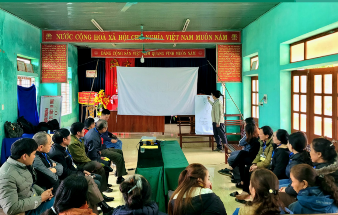
Tập huấn về chính sách chi trả giảm phát thải vùng Bắc Trung Bộ cho cộng đồng quản lý rừng tại xã Kim Hóa, huyện Tuyên Hóa, tỉnh Quảng Bình