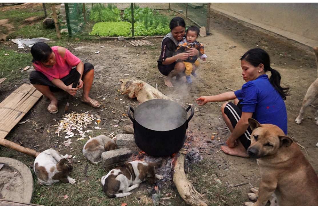
Cộng đồng ở xã Nam Tiến, huyện Quan Hóa, tỉnh Thanh Hóa