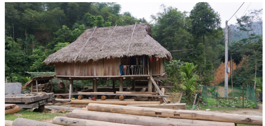
Nhà ở của cộng đồng ở xã Nam Tiến, huyện Quan Hóa, tỉnh Thanh Hóa

Hộ gia đình, cá nhân, cộng đồng là chủ rừng sẽ được Quỹ Bảo vệ và Phát triển rừng cấp tỉnh chi trả trực tiếp thông qua tài khoản ngân hàng, chuyển tiền qua dịch vụ bưu chính hoặc theo các phương thức thanh toán không dùng tiền mặt khác theo quy định của pháp luật.