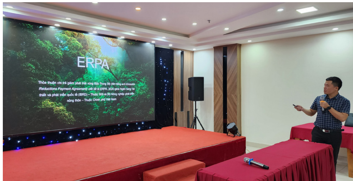
Đại diện PanNature giới thiệu về ERPA tại Tọa đàm "Tăng cường sự tham gia của cộng đồng và các bên liên quan trong cơ chế chia sẻ lợi ích từ giảm phát thải vùng Bắc Trung Bộ", tổ chức tại Quảng Bình tháng 2/2023