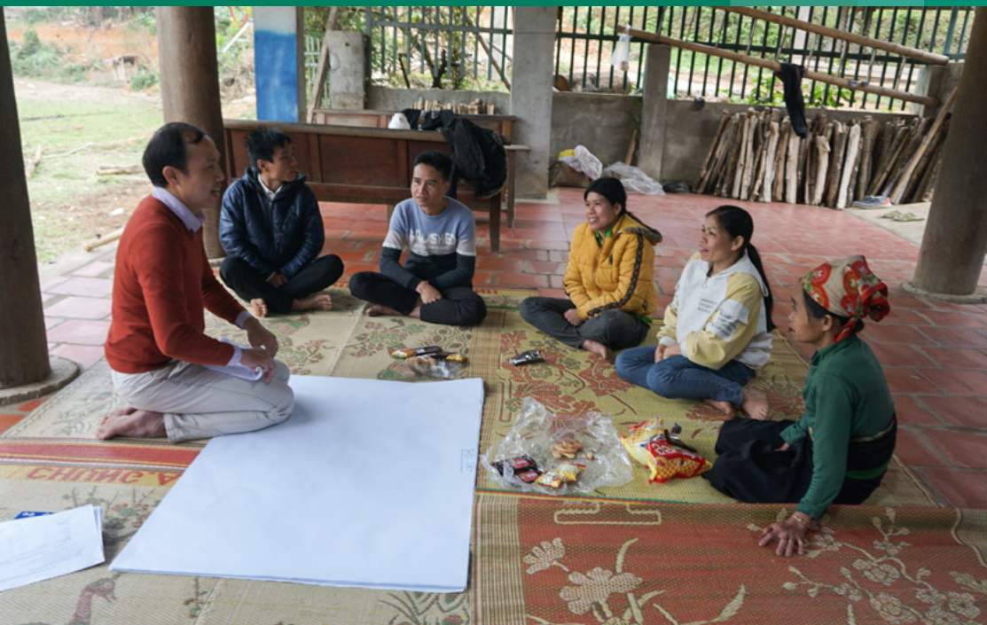
Khảo sát thực địa về mối tương quan giữa biến đổi khí hậu, di cư và sinh kế của các cộng đồng tại xã Nam Tiến, huyện Quan Hóa, tỉnh Thanh Hóa