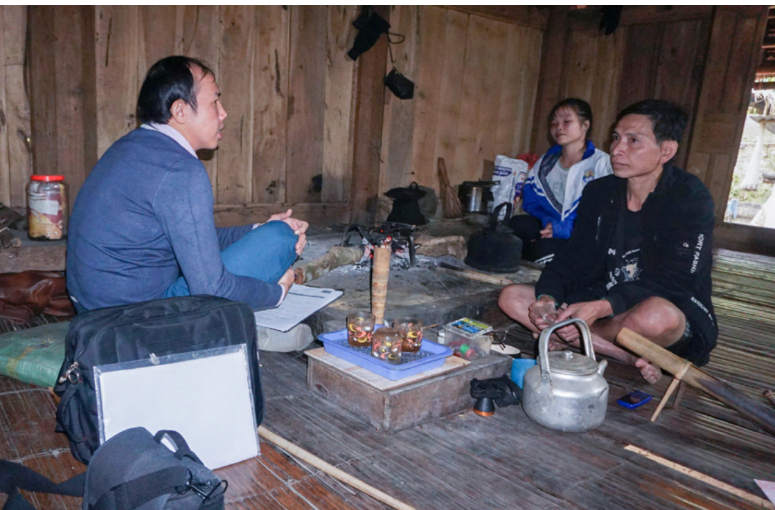
Khảo sát thực địa về mối tương quan giữa biến đổi khí hậu, di cư và sinh kế của các cộng đồng tại xã Nam Tiến, huyện Quan Hóa, tỉnh Thanh Hóa